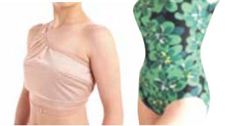
入浴時の乳房カバー／プレスタ