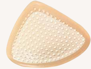
日本シグマックス