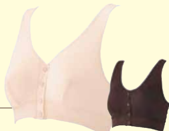
◎C モイスチャーベージュ ◎W1 ダルワイン