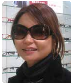
記事担当:ウィッグマッププロジェクト